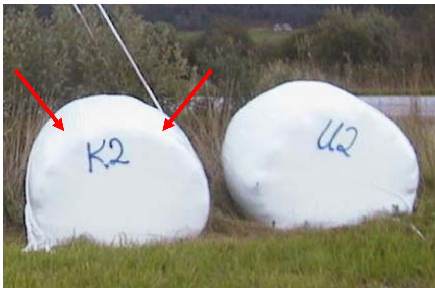
Figur 1. Prøvetaking

Første pH måling ble gjennomført etter 24 timer. Dette ble gjennomført med Ø 5,0 cm prøvebor som ble slått ca 40 – 50 cm inn i ballen fra ca kl. 2 og kl.10 og inn mot sentrum.