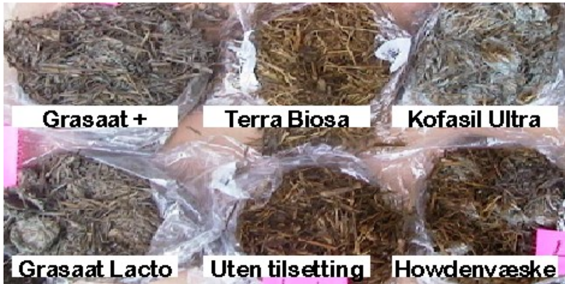
Figur 3. Mugg på halvferdig ensilasje