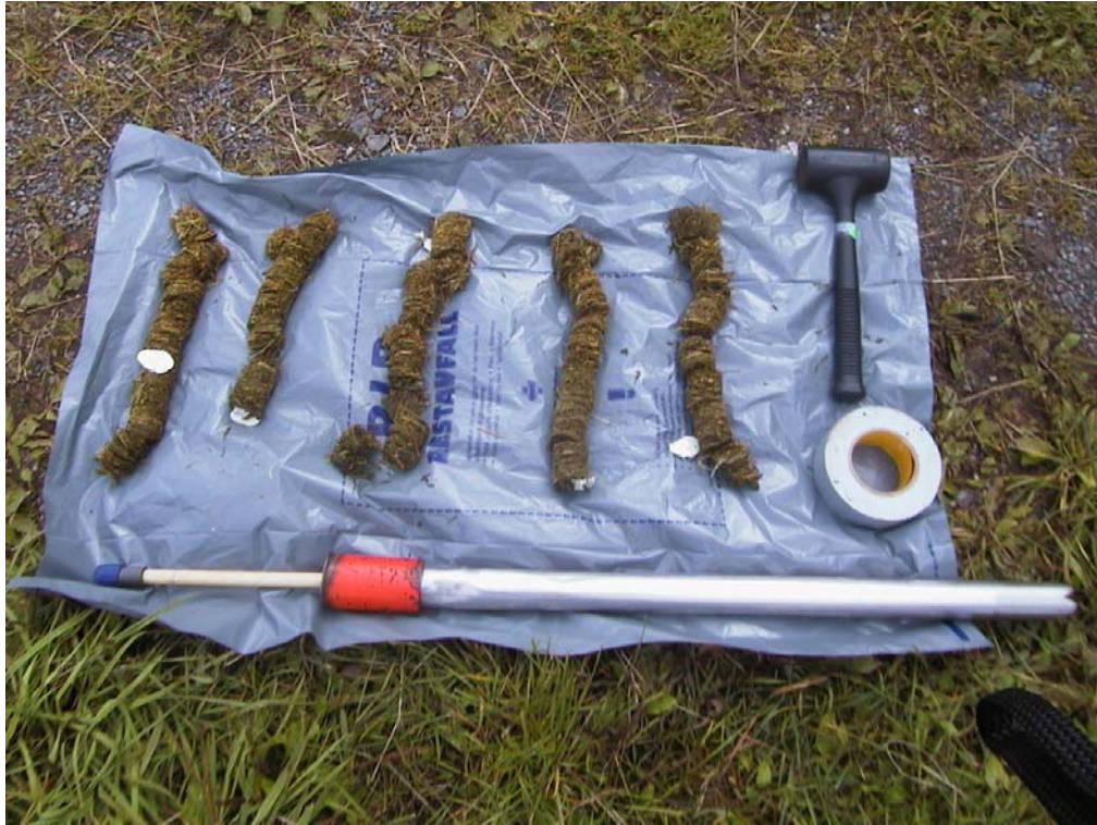
Figur 2. Utstyr for prøveuttak.

Uttatte prøver ble løpende lagt tilside med utetemperatur og lufttilgang for å se hvor raskt angrep av mugg oppstår, og i hvilken grad midla motvirker mugg i fersk ensilasje (innleggingsforhold) og likeså etter at surføret er ferdig omdanna og rekna som stabilt. (uttakingsforhold)